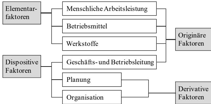
Abbildung 42: Produktionsfaktoren in der Betriebswirtschaft 171

In der Theorie versucht man dieses Ziel über die mathematische Abbildung der Produktionsprozesse in Produktionsfunktionen zu erreichen. In solchen Produktionsfunktionen werden die zu produzierenden Outputmengen (Produkte) den dafür nötigen Inputmengen ( Produktionsfaktoren ) gegenübergestellt: 172