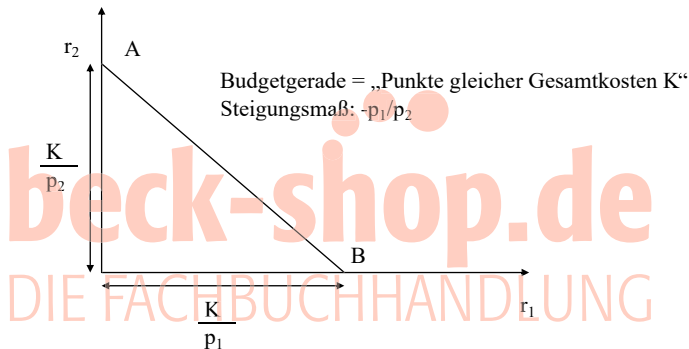
Abbildung 45: Die Budgetgerade 178

Das Ziel einer möglichst kostenminimalen Produktion kann aus dem Minimum-Prinzip 177 abgeleitet werden: Eine gegebene Produktionsmenge soll kostenminimal, d. h. ohne unnötigen Mehrverbrauch von Einsatzfaktoren, hergestellt werden. Graphisch lässt sich dies für zwei Produktionsfaktoren im Sinne einer Minimalkostenkombination darstellen: