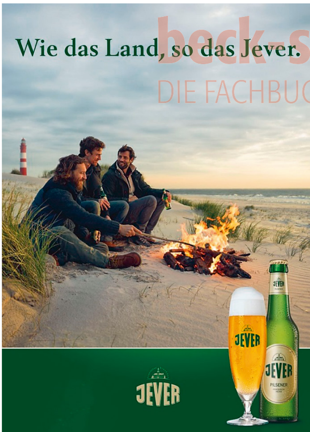
Abb. 64: Vermittlung unverwechselbarer Erlebnisse

Hinzuzufügen ist heute die Frage, inwieweit die Konsumenten aktiv in die Erlebnisgenerierung einbezogen werden können, da in der Regel davon auszugehen ist, dass die Emotionalisierung stärker wirkt, wenn der Konsument nicht nur einfacher passiver Rezipient ist (Gröppel-Klein, 2012c). Last but not least ist auch bei der Erlebnisvermittlung für den Konsumenten Transparenz notwendig, er darf sich nicht getäuscht fühlen.