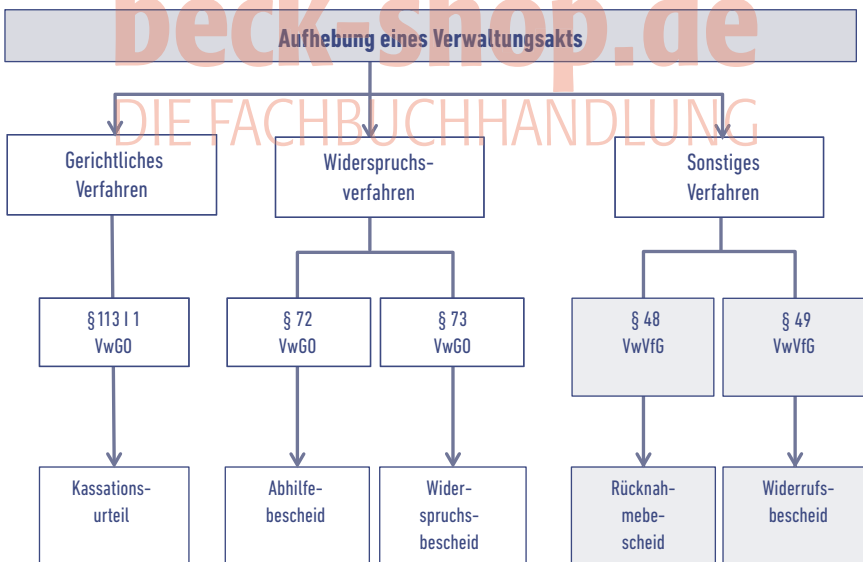
Abb. 55: Aufhebung von Verwaltungsakten