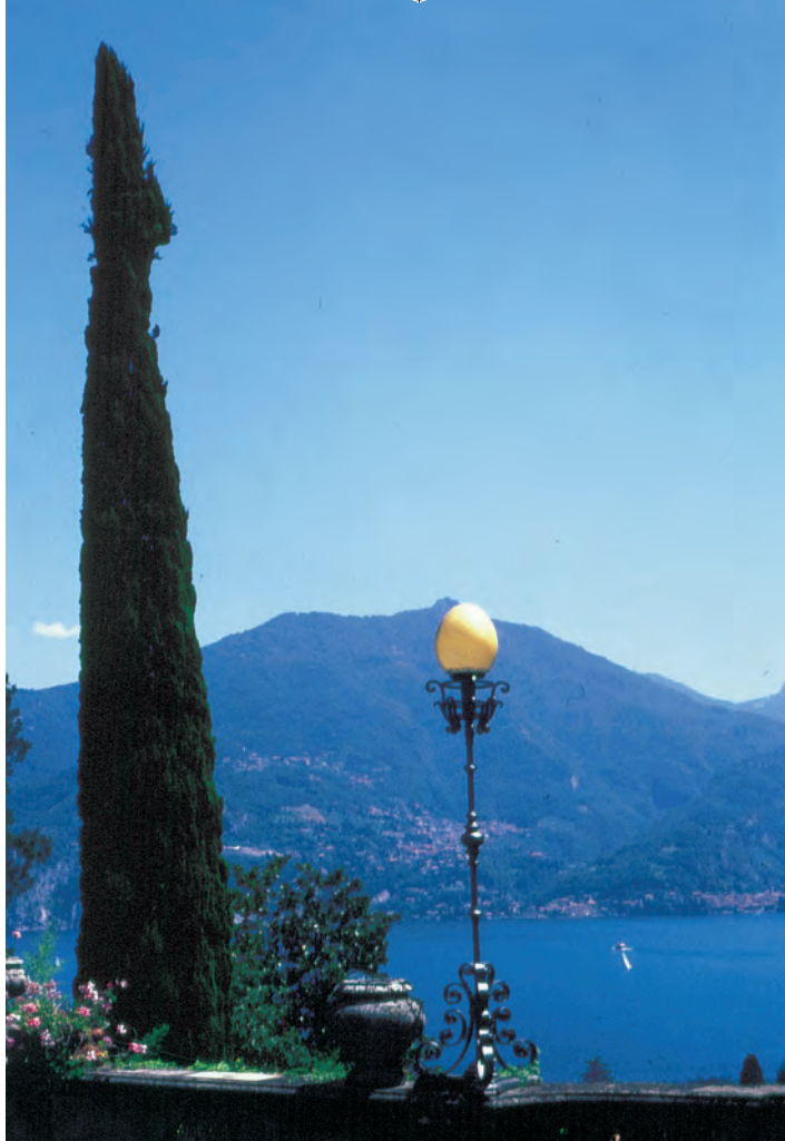
Abb. 2-2 Vom Garten der Villa Carlotta am Comer See blickt man auch auf die spektakuläre Umgebung. Wo der Garten endet, spielt für den Betrachter keine Rolle.