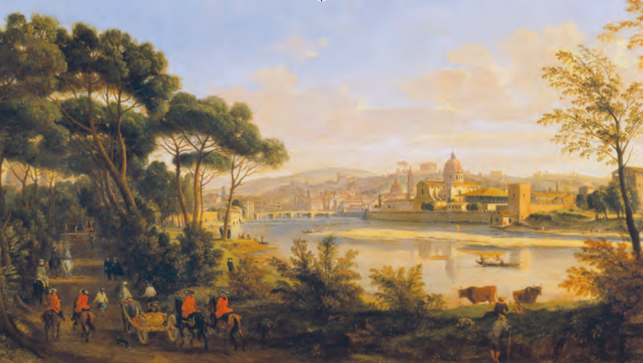
Abb. 2-1 Gaspare Vanvitelli (Caspar von Wittel; 1653–1736): «Ansicht der Stadt Florenz von den Cascinen». – Die Stadt wird als Teil von Landschaft dargestellt.

für die Gartengestaltung und damit verbunden das Landschaftsverständnis ausgegangen sein sollte. 9