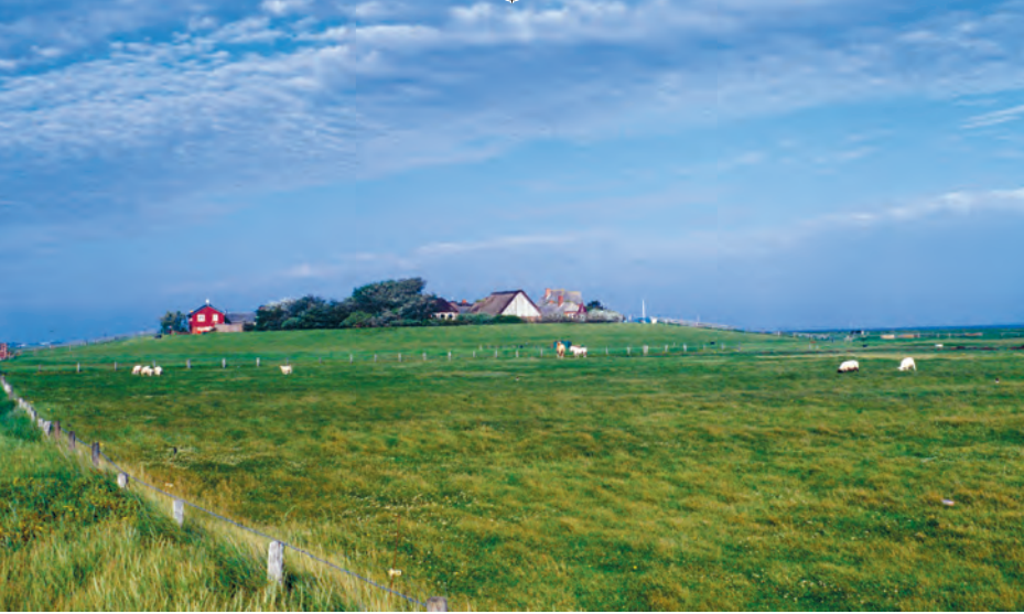
Abb. 2-4 Oland, eine Hallig an der Nordsee, liegt in einer spektakulären Landschaft, die jederzeit von Meeresüberflutung bedroht ist.

schaft wird daher als die «künstlerische, bildliche Darstellung einer [...] Gegend» im Deutschen Wörterbuch von Jacob und Wilhelm Grimm erklärt. 14 Die Landschaft als Bild ist stets das Resultat der Reflexion über Natur und menschliche Gestaltung des Raumes. Darin gehen Interpretationen oder Erfahrungen, kulturelle Konstruktionen, Vorstellungen oder Metaphern ein, beispielsweise über das Paradies, Arkadien und die Natur.