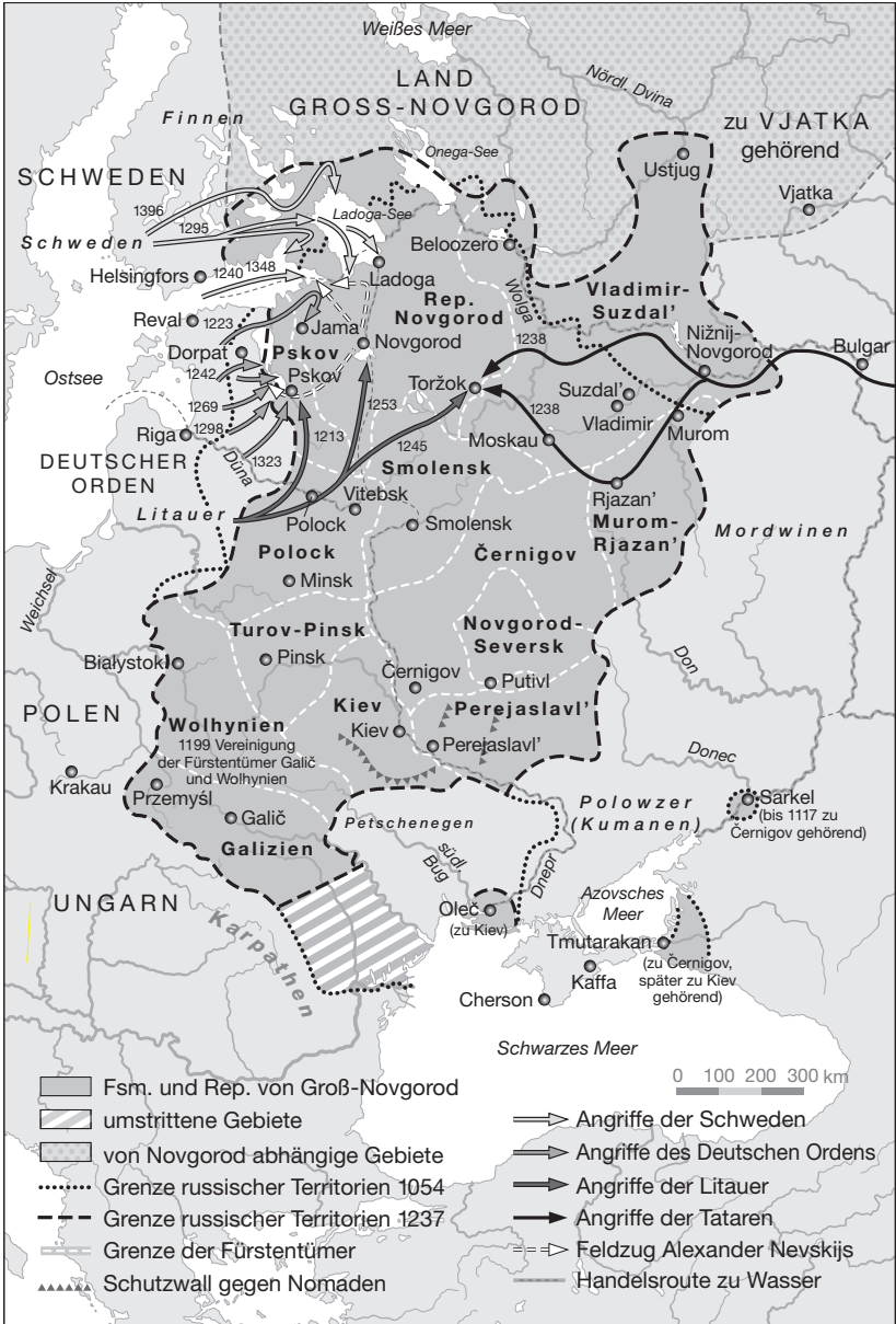
Karte 1: Die Kiever Rus', 1054-1237