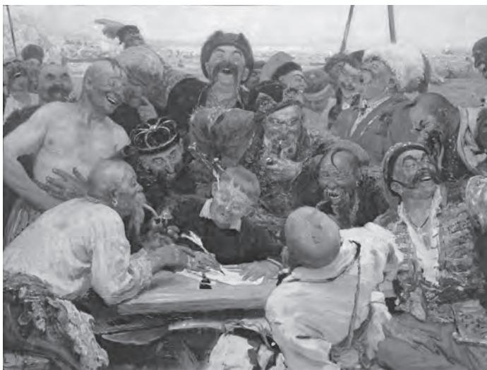
Abb. 1 Historienbild des russischen Malers Ilja Repin: Die Zaporozher Kosaken schreiben einen Brief an den Sultan (1880–91)

lerdings setzte man unterschiedliche Akzente. Die eine Richtung hob die sozialrevolutionären und demokratischen Traditionen der Kosaken und ihren Kampf gegen Polen und Russland hervor, die andere legte den Schwerpunkt auf ihre staatsbildende Kraft, die Formierung des proto-nationalen Hetmanats. Die sowjetukrainischen Historiker waren seit den 1930er Jahren gezwungen, das Hetmanat als Etappe der «Wiedervereinigung» der Ukraine mit Russland zu interpretieren. In der unabhängigen Ukraine wurden die Dnjepkosaken erneut zum bevorzugten Thema der Historiker und übernahmen eine zentrale Rolle in der wiederbelebten nationalen Meistererzählung.