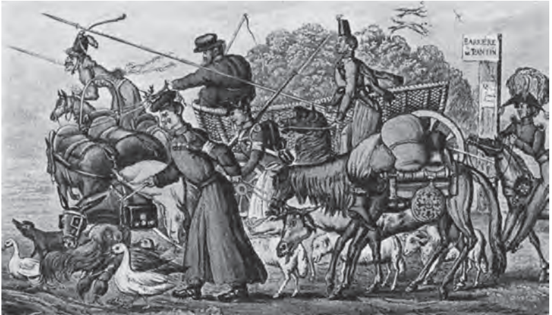
Abb. 2 Kosaken beim russischen Einmarsch in Paris 1814 (Lithographie aus der englischen Schule, 19. Jahrhundert)

Die widersprüchlichen, zum Teil inkompatiblen Kosakenbilder in der Historiographie spiegeln die Widersprüchlichkeit der kosakischen Geschichte wider. Die Tatsache, dass Kosaken sowohl in der russischen, ukrainischen und polnischen Geschichtsschreibung eine wichtige Rolle spielten, macht sie zu einem dankbaren Objekt transnationaler Ansätze.