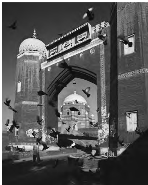
Das Tor von Multan in der Provinz Punjab