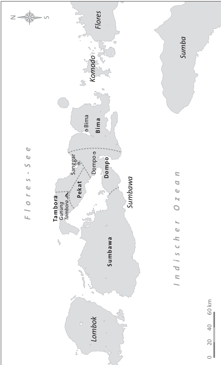
Karte von Sumbawa