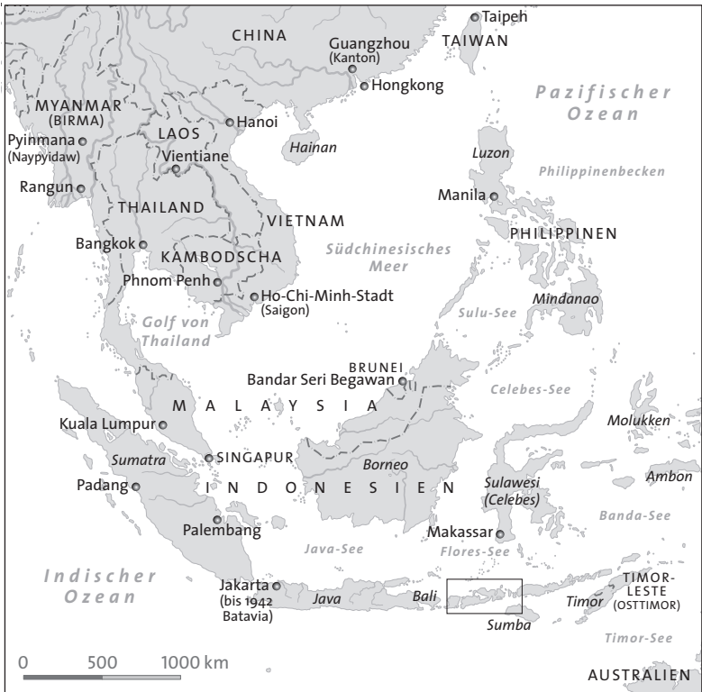
Karte von Indonesien (Ausschnitt: siehe Seite 26)

Mörserfeuer. Es begann am Mittwoch, dem 5. April abends mit wiederholten Explosionen und endete gegen acht Uhr morgens. Dann begann es wieder am Montag [10. April] abends [...] und dauerte bis weit in die nächste Nacht. Gestern [13. April] fiel die Asche so dicht, dass man sich draußen kaum bewegen konnte, weil sie die Augen füllte und die Kleider bedeckte.» 16 Crawford berichtete aus Surabaya: «Am Tag nach den Explosionen und dem Erdbeben, das sie bis nach Surabaya begleitete, begann der Ascheregen, und am dritten Tag wurde es gegen Mittag rabenschwarz. Einige Tage lang musste ich alle meine Geschäfte bei Kerzenlicht erledigen. Einige Monate lang konnte man tatsächlich die Sonnenscheibe nicht klar wahrnehmen und die Atmosphäre war