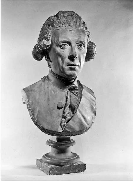
Jean-Antoine Houdon: Prinz Heinrich (1784)

nes Landes über ihn hereingebrochen war, hegte Friedrich erneut Freitodpläne. Eine Vielzahl entsprechender Äußerungen sind überliefert. Aber nach wenigen Tagen kaum zu ermessender Niedergeschlagenheit fasste er neuen Mut. Er übernahm wieder den Oberbefehl, ließ Geschütze beschaffen und stieß nach Südwesten auf Fürstenberg vor, um den mittlerweile über die Oder gesetzten Alliierten den Weg nach Berlin zu verlegen. Daun stieß mit einem Kontingent der österreichischen Armee flankiert von einem weiteren Detachement nach Norden vor, um die Operationen der Verbündeten zu unterstützen. Doch am 28. August, gut vierzehn Tage nach dem Treffen von Kunersdorf, wandten sich die Russen mit dem Argument, sich genügend für das Kriegsziel aufgeopfert zu haben, nach Süden in Richtung auf Lieberose und zogen auch die Heeresgruppe unter Loudon mit sich, die aus logistischen Gründen auf die Unterstützung der Russen angewiesen war. Dieser Abmarsch erschien Friedrich wie