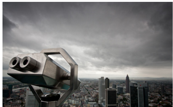
Gewinnerbilder der Foto-Challenge in Frankfurt mit den Themen Kreativ (l), Menschen (m) und Stadt/Landschaft (r)

ten wir genug Filmmaterial gesammelt, um ein interessantes Video zusammenzuschneiden. Gerade noch rechtzeitig zum Abgabetermin hatte ich alles komplett und schickte es weg. Nun galt es abzuwarten. Laut Internetseite hatten sich mit mir über tausend Fotografen auf diesen außergewöhnlichen Job als fotografierender World Scout beworben. Diese Bewerbungen mussten von SIGMA akribisch ausgewertet werden, denn es konnte letztendlich ja nur einen World Scout geben. Tage und Wochen vergingen, dann endlich der ersehnte Anruf: Ich war in der engeren Auswahl und sollte mit neun Mitbewerbern mein Können bei einer Foto-Challenge in Frankfurt unter Beweis stellen!