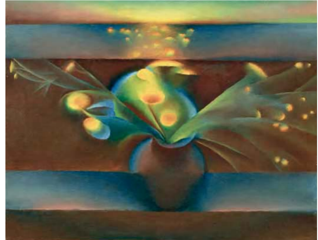
47 | BUTTERCUPS / ЛЮТИКИ 1964 70 x 90 cm