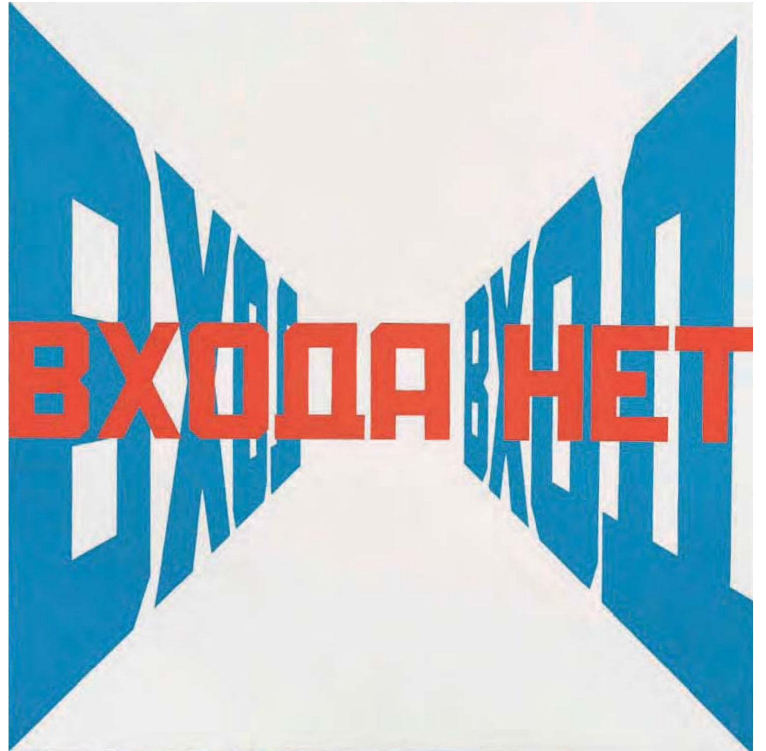
87 | ENTRANCE - NO ENTRANCE / ВХОД - ВХОДА НЕТ 1974-75 180 x 180 cm