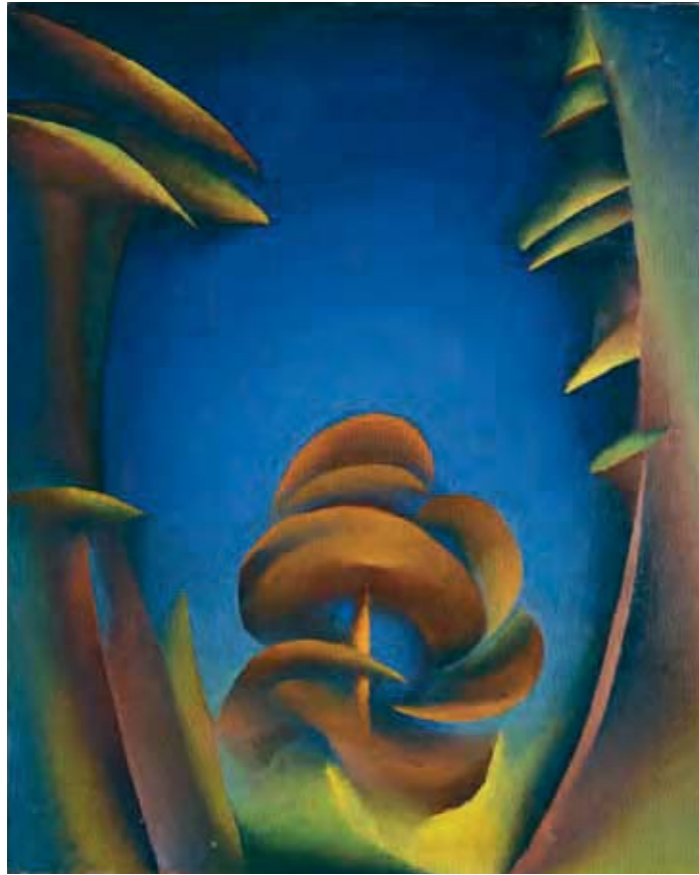
45 | LANDSCAPE. TREETOPS / ПЕЙЗАЖ. ВЕРХУШКИ ДЕРЕВЬЕВ 1964 99 x 79 cm