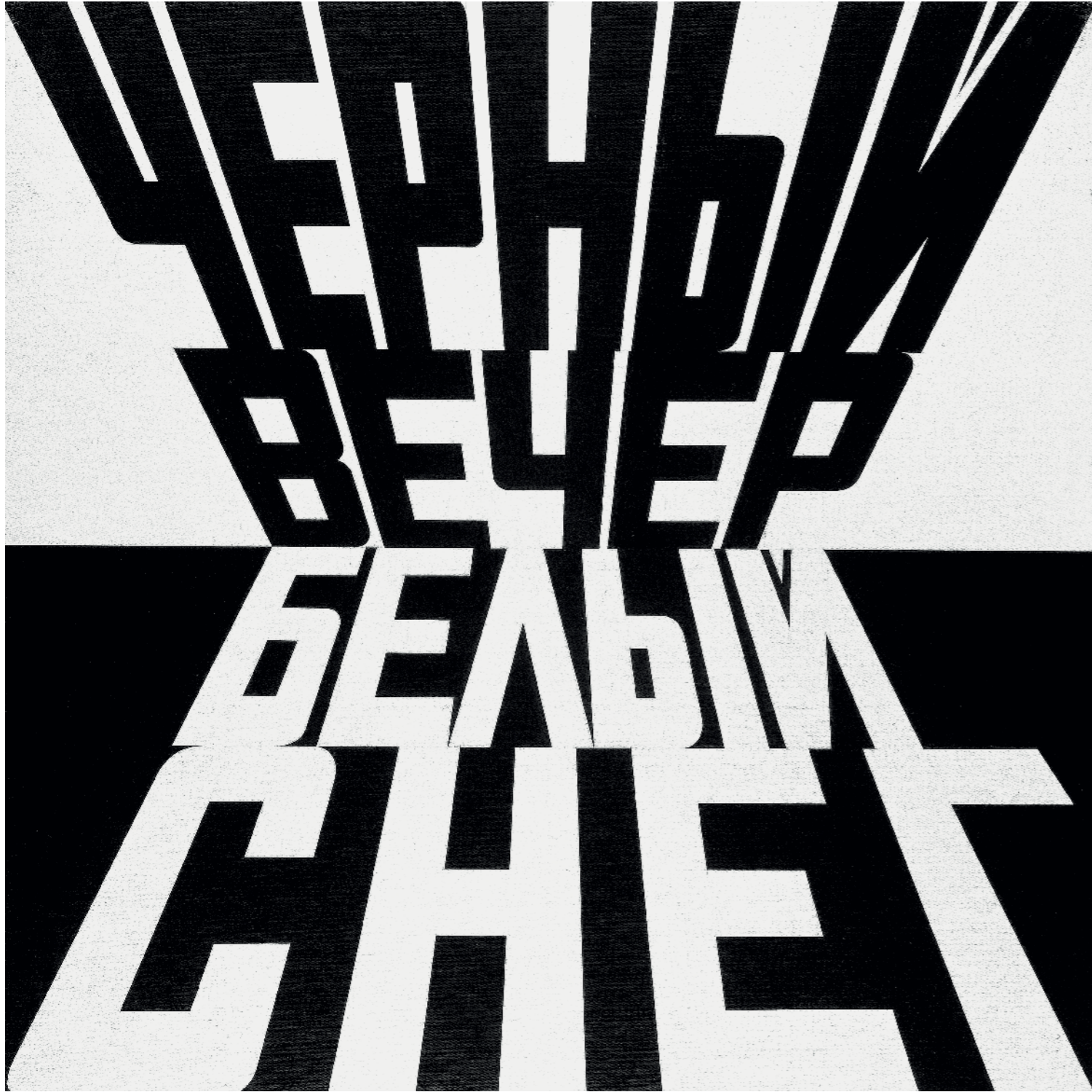
193 | BLACK NIGHT – WHITE SNOW (from the series HERE) / ЧЕРНЫЙ ВЕЧЕР – БЕЛЫЙ СНЕГ (из серии ВОТ) 2000 200 x 200 cm