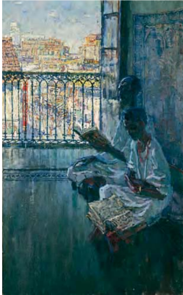
5 | CALCUTTA / КАЛЬКУТТА 1956 120 x 74 cm