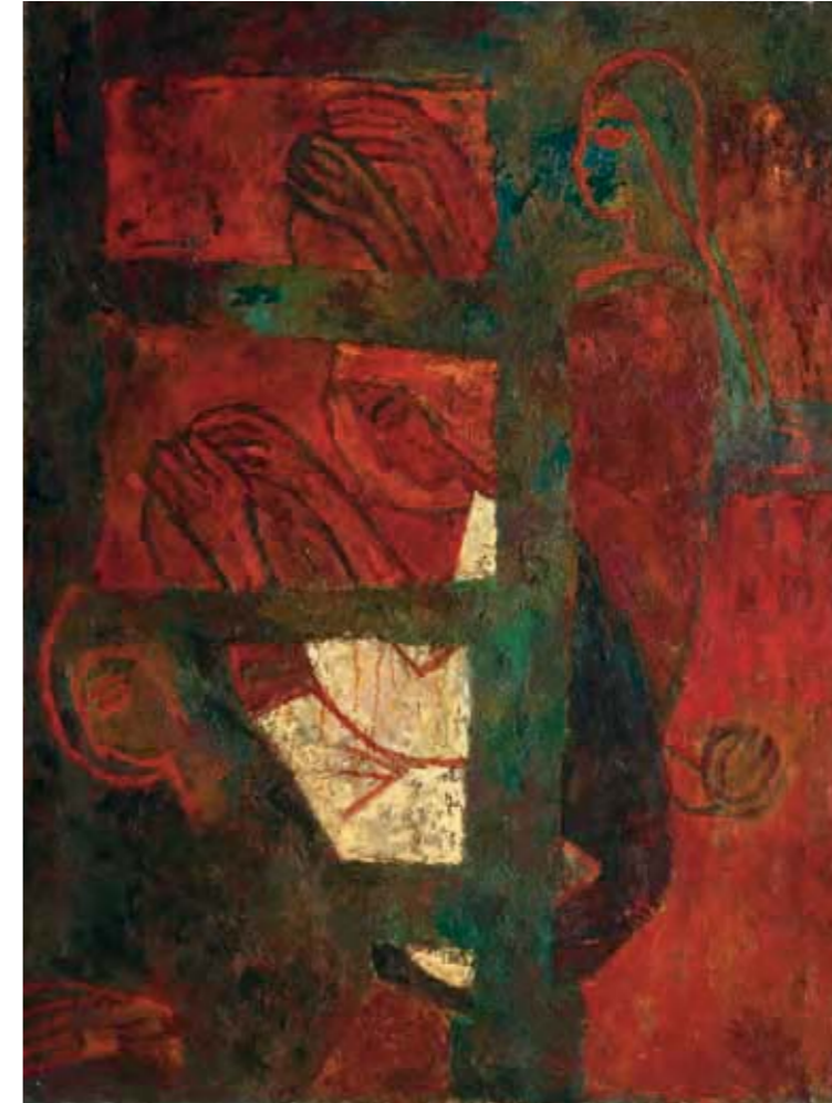
13 | UZBEK CARPET WEAVERS / УЗБЕКСКИЕ КОВРОВЩИЦЫ 1958-59 120 x 90 cm