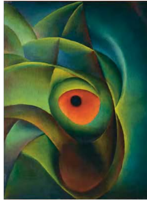
46 | POPPY / МАК 1964 72.5 x 62 cm