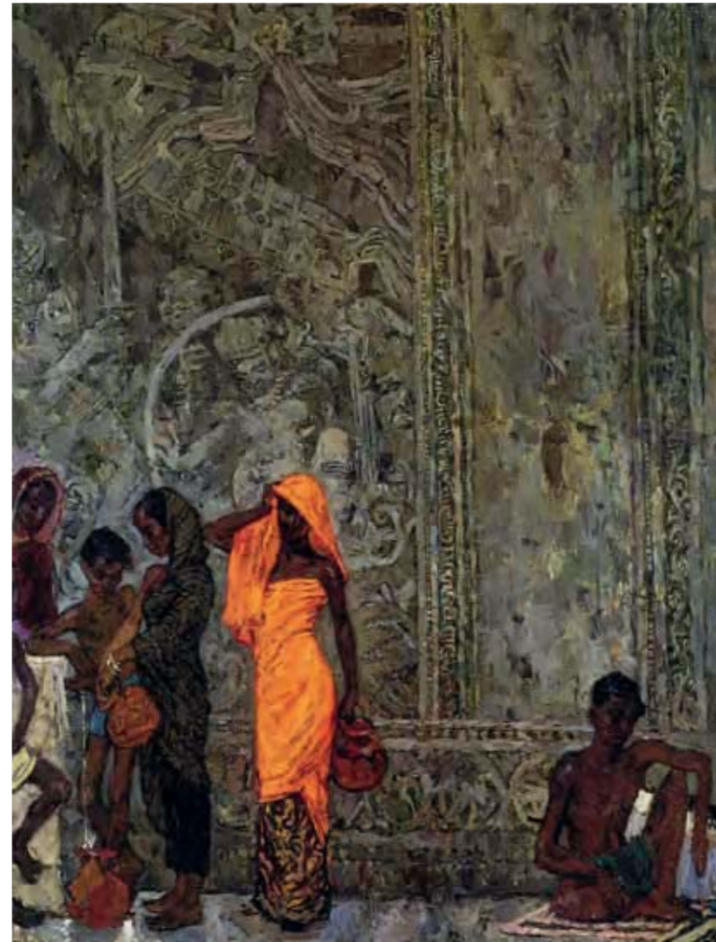
7 | AT THE SPRING / У ИСТОЧНИКА 1957 128 x 100 cm