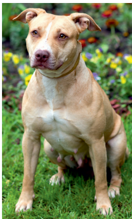
Abb. 8: American Pit Bull Terrier