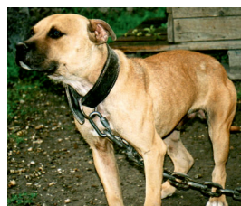
Abb. 12: American Pit Bull Terrier