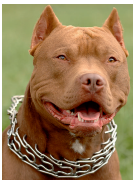
Abb. 7: American Pit Bull Terrier