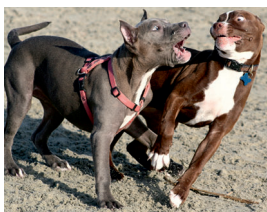
Abb. 10: American Pit Bull Terrier