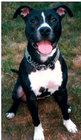
Abb. 11: American Pit Bull Terrier