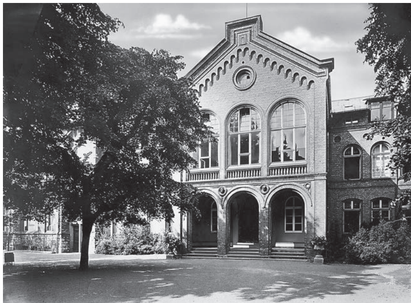
Abb. 2: Auguste Viktoria-Schule Ansicht von Süden (Viktoria-Str.)