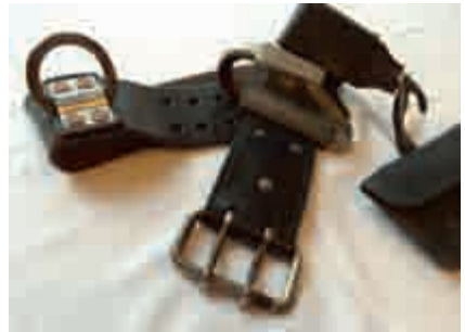
Abbildung 2: Hakengurt nach 1938