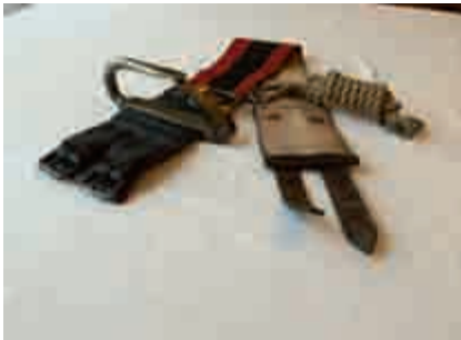
Abbildung 1: Feuerwehrgurt vor 1938

Von den Gründerjahren der Feuerwehren und der Grundlagenarbeit des C.D. Magirus bis heute haben sich die verwendeten Gurte immer wieder dem technischen Fortschritt und den Einsatztaktischen Erfordernissen in Form und Anwendung angepasst.