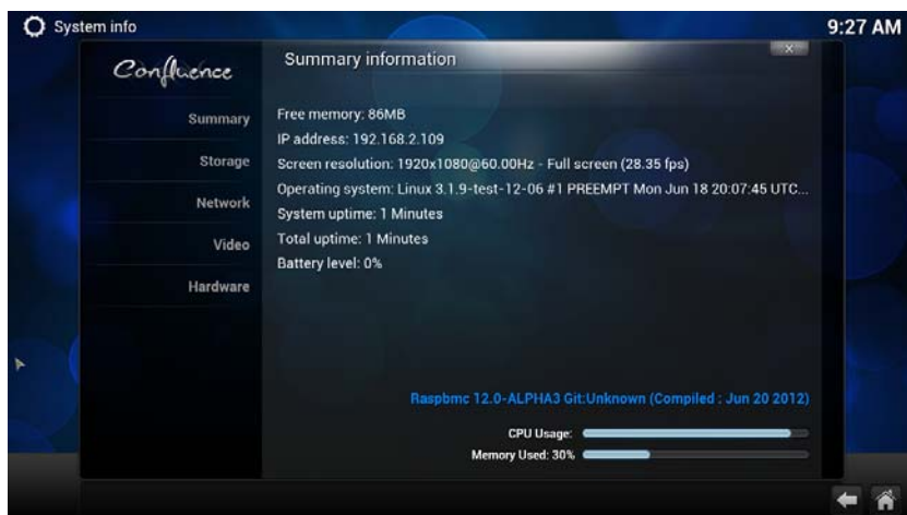
Abb. 7-3 Im Settings Menu von Raspbmc können Sie viele Parameter einstellen.

Um die Möglichkeiten von XBMC voll ausschöpfen zu können, sollten Sie diese Software mit Ihrem Netzwerk verbinden. Wenn Ihr Pi bereits über Ethernet angeschlossen ist, müssen Sie dazu nichts tun, denn XBMC erkennt diese Verbindung automatisch. Wollen Sie dagegen das WLAN verwenden, wählen Sie Programs > Raspbmc > Settings und setzen den Netzwerkmodus auf der Registerkarte Network Configuration (siehe Abbildung 7-3) auf Wireless (WIFI) Network . Geben Sie dann die SSID des WLANs und Ihr Passwort ein. Gewöhnlich ist es praktisch (aber nicht notwendig!), für den Pi eine statische IP-Adresse festzulegen, wenn er XBMC ausführt. Deaktivieren Sie dazu Use DHCP und geben Sie unter IP address eine IP-Adresse ein, die in Ihrem Netzwerk sonst nicht vorkommt. Klicken Sie auf OK. Das war es auch schon.