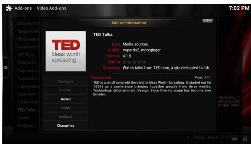
Abb. 7-4 Add-ons in XBMC verwalten

XBMC ist jedoch mehr als ein einfacher Media-Player. Sie können ihn durch viele Add-ons verbessern und erweitern, die gratis im Web erhältlich sind. Einfach gesagt geben Ihnen Add-ons Zugriff auf Medien im Web. Zum Beispiel finden Sie Add-ons, die den Inhalt bestimmter Fernsehsender sammeln, oder Add-ons, mit denen Sie Zugriff auf die Musik toller Videospiele bekommen. XBMC bietet sogar einen bequemen Weg zur Verwaltung der Add-ons. In der folgenden Abbildung sehen Sie das Add-on TED, das die neuesten und besten TED-Konferenzvideos anzeigt.