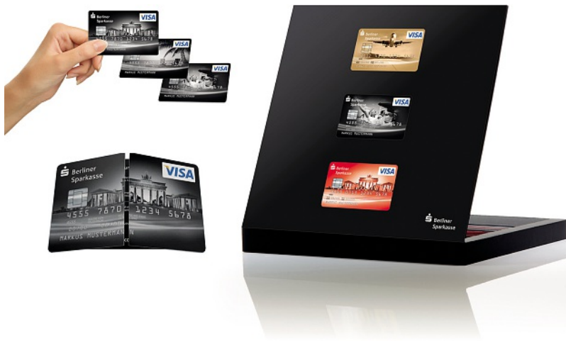
Abb. 4: Mehr Umsatz mit Wackelbildern und Endlosfaltkarten.

chen die Berater plötzlich von ganz alleine auf die Kreditkarten an und die Berater schenkten den Kunden eine der Wackel-Karten. Die jeweilige Kreditkartenvariante erklärten die Finanzberater danach mithilfe einer separaten logoloop-Endlosfaltkarte (siehe Abb. 4). Die Kunden entdeckten die Vorteile der Kreditkarte nun selbst, indem sie diese auf den vier Seiten der Karte entfalteten und entfalteten und entfalteten und entfalteten ... Der Kreditkartenabsatz schnellte in die Höhe: Innerhalb von drei Monaten verkauften die Berliner Sparkassenberater so viele Kreditkarten wie sonst innerhalb eines ganzen Jahres. Die monatliche Absatzsteigerung betrug über 50 Prozent. Warum entfalten Wackelbilder und Endlosfaltkarten eine derart große Überzeugungskraft?