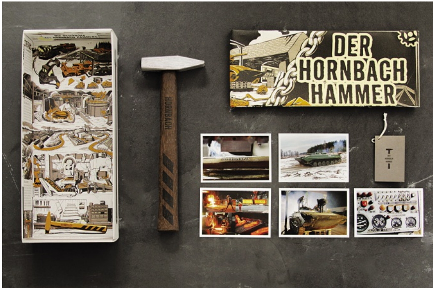
Abb. 2: Hornbachs Hammer – geboren aus Panzerstahl, gemacht für die Ewigkeit.