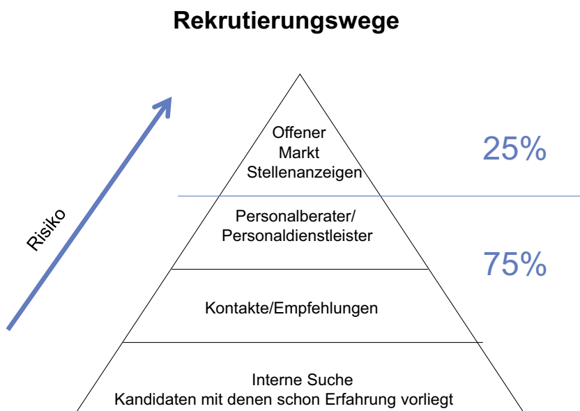
Abb. 2: Rekrutierungswege

Wer über ein gutes Netzwerk verfügt, erfährt bereits von Stellen, die noch nicht offiziell ausgeschrieben sind oder wird sogar direkt angesprochen. Viele Unternehmen bitten ihre Mitarbeiter ganz konkret um Kandidatenvorschläge. Daher ist der Kontakte zu ehemaligen Studienkollegen hier eine gute Möglichkeit ins Gespräch gebracht zu werden. Kontakte lassen sich auch sehr gut auf Fach- oder Rekrutierungsmessen knüpfen. Bei der Kontaktaufnahme wird die eigene kurze Vorstellung von entscheidender Bedeu-