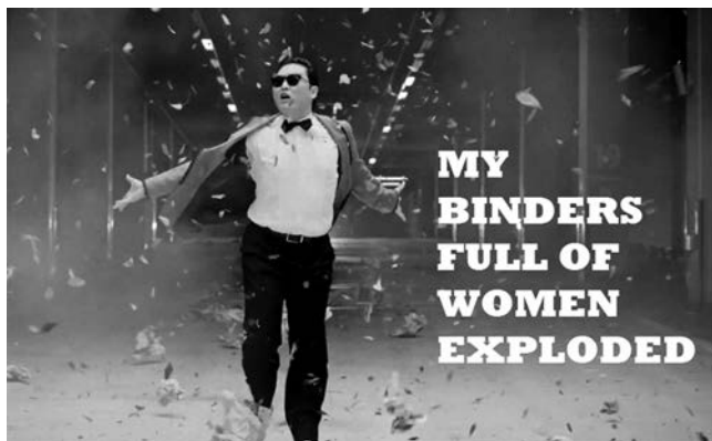
Abbildung 1 »Gangnam Style« trifft auf »Binders Full of Women«. Quelle: { http://bindersfullofwomen.tumblr.com/post/33778010755/op-pa-binder-style } (zuletzt abgerufen am 25. Mai 2014).*