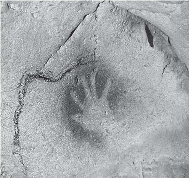
1. Abdruck einer menschlichen Hand in der Chauvet-Höhle in Südfrankreich. Diese Kunstwerke sind etwa 30 000 Jahre alt und wurden von Menschen hinterlassen, die aussahen, dachten und fühlten wie wir. Vielleicht wollte er oder sie sagen: »Ich war hier!«