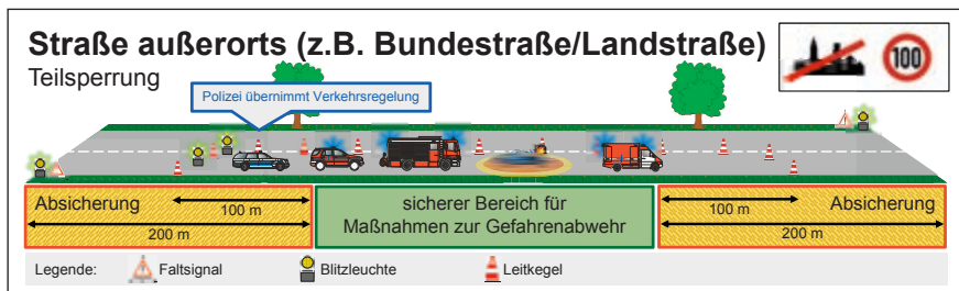
Abb. 8.6.2/1: Teilspernung auf einer Straße außerorts (Grafik: Weich)

Leitpfosten an Straßen und Autobahnen haben in der Regel einen Abstand von 50 m. Somit ist eine Entfernungsabschätzung leicht möglich.