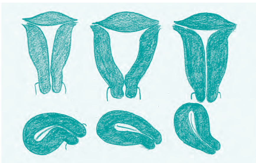
Abb. 12: Verschiedene Formen der Gebärmutter: Manche sind weit, andere eng und schmal, manche gebogen oder nach hinten abgeknickt. Die obere Reihe zeigt die Ansicht von vorne, die untere von der Seite. Seitlich gesehen entspricht die Gebärmutterhöhle eher einem Spalt.

In der Praxis, in der ich Ende der 1990er-Jahre meine Facharztausbildung beendete, wurden Multiload (ovales IUP mit Häkchen) in zwei Größen gelegt: die normalen für die Frauen, die schon geboren hatten, und die kleinen für Frauen ohne Kinder. Fertig! Und damit kamen vielleicht 80 Prozent der Frauen auch gut klar. Bei denen, die starke Blutungen hatten, auch nach sechs Monaten noch über Zwischenblutungen klagten oder unter Schmerzen litten, wurde die Spirale vorzeitig wieder entfernt. Da Schmerzen und Blutungsprobleme zu den bekannten Nebenwirkungen gehörten, die ein Teil der Frauen einfach hat-