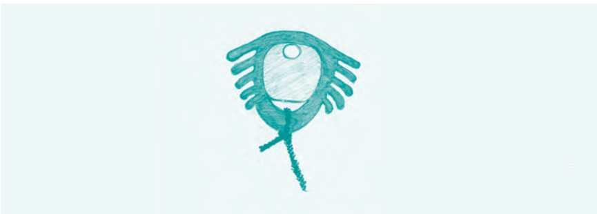
Abb. 11: Dalkon-Shield: 2,5 x 2,2 cm. Es war erstaunlich klein, für den Ärger, den es verursacht hat ...

Alle diese frühen Modelle der intrauterinen Verhütung hatten ein Problem: Ihre Wirkung beruhte auf ihrer Größe. Sie verhüteten umso sicherer, je mehr Kontakt sie zur Gebärmutterwand hatten und dort die Schleimhaut irritierten. Aber die großflächigen Druckstellen führten bei vielen Anwenderinnen auch zu starken Menstruationskrämpfen und hohem Blutverlust. Blutarmut und monatliche Krämpfe waren für viele Frauen der Preis für die sicherste Verhütungsmethode, die es bis zur Mitte der 1960er-Jahre gab.