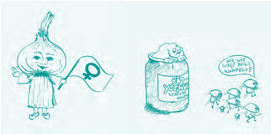
Abb. 1: Illustrationen zum Vortrag »Selbsthilfe bei häufigen Vaginalpilzinfekten« im FFGZ Kiel e.V. 1992 – heute würde ich weder Knoblauchzehen für die vaginale Anwendung empfehlen, noch Joghurt, aber das ist eine andere Geschichte.

Nach ein paar Jahren stieg ich dann auf eine Portiokappe um. Auch Kondome waren wieder Thema, nachdem meine erste Beziehung zu Ende war, was unfreiwillig zu einem Selbstversuch mit der »Pille danach« führte. Damals noch die Yuzpeh-Methode (Tetragynon): Was war mir schlecht! Bloß nicht neben das Mikroskop erbrechen! Und ich saß an diesem Morgen in der ersten Reihe vor unserem Professor ... Die modernere Nachverhütung ist Göttin sei Dank nicht nur effektiver in der Verhütung von Schwangerschaften, sondern auch viel besser verträglich, wie im Kapitel 10 »Nachverhütung« beschrieben. Die vier Tabletten blieben drin, kein Kind im Medizinstudium, erst mal war alles wieder gut.