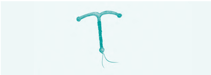
Abb. 13: T-380: Je nach Größe (klein, mittel, groß) 3 bis 3,8 cm lang mit einer Spannweite von 2,4 bis 3,65 cm

In Dänemark können Frauen auf Kosten des öffentlichen Gesundheitssystems eine Spirale bekommen, leider nach genau diesem Strickmuster. Eine Freundin von mir, die mit einem Dänen verheiratet ist, fragte mich vor einigen Jahren, warum um alles auf der Welt ich Spiralen legen würde. Sie hätte seit der Einlage ihres IUP vor vier Monaten ständige Unterbauchbeschwerden. Es stellte sich heraus, dass sie nach drei Schwangerschaften mit zwei Geburten und einer Fehlgeburt eine Nova-T-Spirale bekommen hatte, die oben relativ breit ist. Sie hatte aber eine sehr schmale Gebärmutter – mit einer guten Rückbildung kann auch nach dem zweiten oder dritten Kind die Gebärmutter wieder sehr eng werden. Als Voruntersuchungen hatten ein Krebsfrüherkennungsabstrich und ein Blick unters Mikroskop ausgereicht, ein Ultraschall war nicht durchgeführt worden. Wie gesagt, das muss auch nicht sein, aber die »Trefferquote« wird höher und somit bleiben mehr Frauen nebenwirkungsfrei. Ich tauschte ihre Spirale gegen ein langes Gynefix aus, dass sie jetzt im dritten Jahr beschwerdefrei trägt. Nach den Ausführungen, könnte frau denken, kleiner sei immer besser – nein, zu große Schuhe machen auch keine Freude. Zu kleine Spiralen können schnell in der Gebärmutter verrutschen oder herausfallen. In Israel wurde eine Verhütungskette mit Kupferperlen (IUB = intrauterine ball) entwickelt, die in der Gebärmutter die Form eines