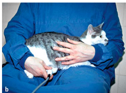
Abb. 2-7 Fixation der Katze zur sonografischen Untersuchung von Uterus und Ovarien, a stehend, b auf dem Schoß der untersuchenden Person.

Dabei kann – abweichend von der beschriebenen Positionierung der Katze – versucht werden, zur Untersuchung des rechten Ovars die Vorderbeine der Katze auf den linken Oberschenkel der untersuchenden Person zu legen, sodass bei nach links gerichtetem Kopf der Vorderkörper etwas erhöht ist (► Abb. 2-7, b). Mit der rechten Hand wird dann der Schallkopf entlang der rechten Flanke geführt. Für die Untersuchung des linken Ovars wird spiegelbildlich verfahren. Im typischen Fall ist das Ovar in einem spitzen Winkel zwischen dem konvexen laterocaudalen Rand der Niere und der angrenzenden Haut-Muskel-Schicht zu finden.