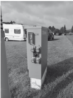
Bild 9.2 Verteiler auf dem Campingplatz für vier Stellplätze