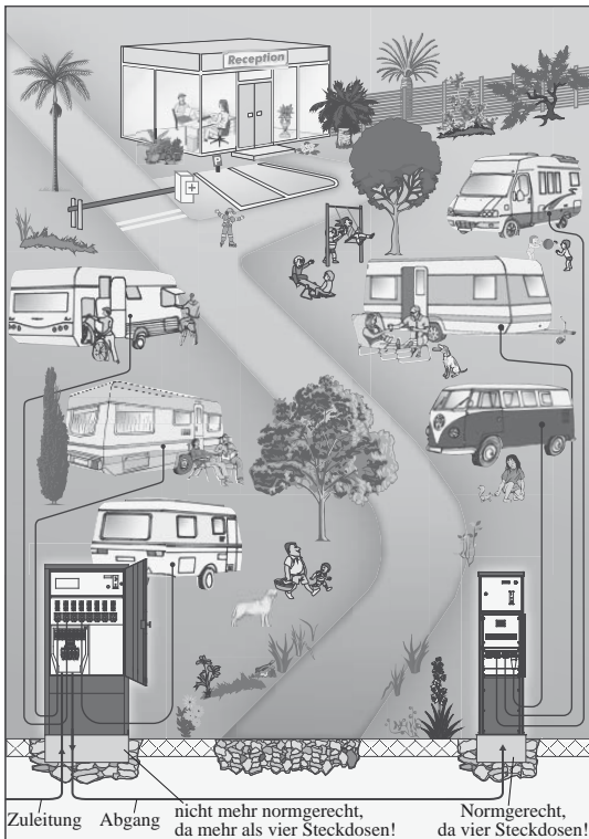
Bild 9.1 Schemadarstellung – Versorgung der Stellplätze mit jeweils einer Steckdose; max. vier pro Verteiler

bestehen, d. h., im TN-S-System sind separate Neutralleiter und Schutzleiter vom Transformator bis hin zu den Betriebsmitteln geführt.