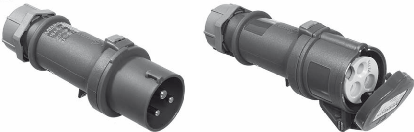
Bild 9.5 CEE-Steckvorrichtungen (Mennekes)

In einem Verteiler bzw. Gehäuse dürfen max. nur vier Steckdosen (Schutzart mindestens IP44) untergebracht sein, damit lange Verlängerungsleitungen zwischen den Steckdosen und den Stellplätzen möglichst vermieden werden. Die Steckdosen sollten so installiert sein, dass deren Unterkante in einer Höhe zwischen 0,5 m und 1,5 m über der Erdgleiche liegen. Bei Überflutungsgefahr oder anderen Hochwasser- und extremen Schneerisiken kann die ansonsten max. Höhe von 1,5 m überschritten werden, damit gefahrloses Bedienen der Steckvorrichtungen möglich ist. Dazu kann die Elektrofachkraft bei der Projektierung der Anlagen zusätzliche Maßnahmen, die geeignet erscheinen, durchführen. Gegen Überstrom ist jede Steckdose einzeln zu sichern.