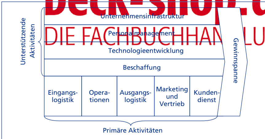
Darstellung 24: Wertkette nach Porter

Geschäftsprozesse lassen sich in Hauptprozesse teilen, wobei sich Hauptprozesse durch ihren Kostenstellen übergreifenden Charakter auszeichnen. Sie setzen sich wiederum aus verschiedenen Teilprozessen zusammen, die in den einzelnen Kostenstellen erbracht werden. Gesucht werden in einer Prozesskostenrechnung möglichst wenige Hauptprozesse, die einen großen Teil der Gemeinkosten verursachen. Gerade die Betrachtung von Kostenstellen übergreifenden Hauptprozessen wird von Vertretern einer Prozesskostenrechnung als herausragendes Merkmal bezeichnet (vgl. Horváth et al., 1993, S. 617). Wenn Prozesse als zusätzliche Kostenobjekte in einer Kosten- und Erfolgsrechnung eingeführt werden, dann müssen sie ähnlich wie Kostenstellen oder Kostenträger eindeutig abgrenzbar sein. Viel wichtiger ist allerdings ihre Messbarkeit, da sie als Mittel angesehen werden, Kosten auf Kostenträger zuzurechnen. Daher gilt die Prozessmenge (= Anzahl der Haupt- oder Teilprozesse) in der Prozesskostenrechnung als Kosteneinflussgröße, die über Cost Driver und Maßgrößen gemessen wird (vgl. Horváth & Mayer, 1993, S. 18). Leider hat sich eine spezielle Terminologie entwickelt, die den im vorigen Kapitel eingeführten Begriff Bezugsgröße ersetzen soll, sie ist in der Tabelle 32 wiedergegeben (vgl. zur Wahl von Bezugsgrößen Glaser, 1997).