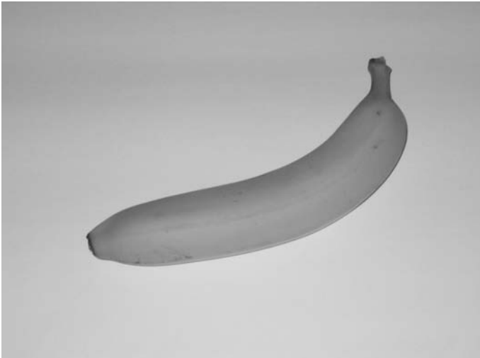
Bild 1.2 Eine Banane, die ihre Kompetenz sichtbar macht