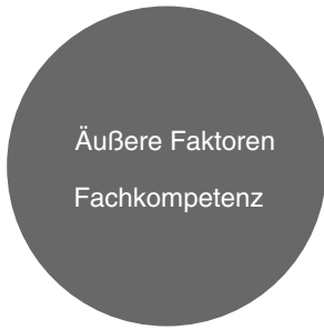
Bild 1.5 Man kennt Sie und kann Ihre Fachkompetenz beurteilen – äußere Faktoren unterstützen oder untergraben die Wahrnehmung Ihrer Fachkompetenz

Jede Branche hat Ihre eigenen Spielregeln in Bezug auf die Anforderungen an die optimale Art und Weise, wie Fachkompetenz sichtbar gemacht wird. Mit diesen Regeln sollten Sie sich vertraut machen und sich danach richten.