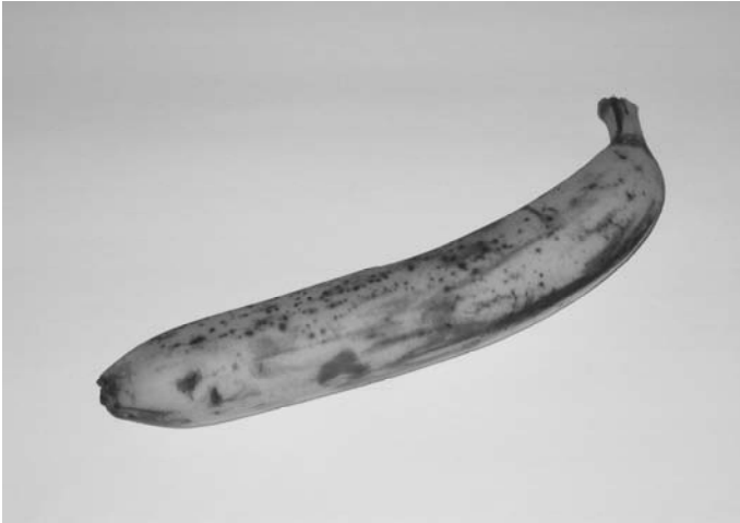
Bild 1.1 Eine Banane, die ihre Kompetenz nicht sichtbar macht

„Kompetenz“ der Banane und kommen mit großer Wahrscheinlichkeit zu dem Schluss, dass diese Banane frisch, der Geschmack ausgeprägt, die Konsistenz optimal und der Anteil an Inhaltsstoffen ausgewogen ist.