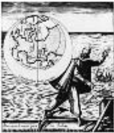
Don Cristóbal Colón bei der Eroberung der Welt

Gold und Indio-Sklaven nach Spanien zurück. Mit an Bord ist der wichtigste Text über diese Reise: der Memorial , eine Art Liste von Anweisungen für seinen Beauftragten Antonio Torres. Darin wird vorgeschlagen, die notwendige Ausrüstung (Geräte, Saatgut, Tiere) mit Sklaven aus wilden Kannibalen zu bezahlen. Die würde man damit (durch ihre Christianisierung) vor der Hölle retten, die sanften Indios würde man vor ihnen schützen, und das wirtschaftliche Problem wäre auch gelöst.