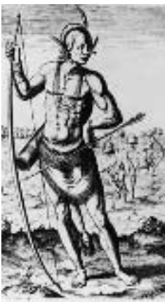
Zeitgenössische Darstellung des primitiven Wilden (um 1590)

Paradies und von außereuropäischen Reichtümern an der Wirklichkeit zu erproben. Sein Text, das Bordbuch der ersten Reise, liegt uns nicht im Original, sondern in einer auszugsweisen Transkription des Paters Las Casas vor, der wohl kein unverdächtigter Herausgeber ist, sondern diese Schriften auch im Kontext seines Kampfes für die Rechte der Indios einsetzen wollte.