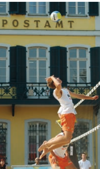
Sportevent vor ungewöhnlicher Kulisse

und die freie Behandlung der Sonatenform, die »Fantasie«. Bei der feierlichen Einweihung des Denkmals am 22. August 1845 kam es zu einer peinlichen Situation: König Friedrich Wilhelm III. von Preußen und Königin Victoria von England hatten bei seiner Einweihung Ehrenplätze auf dem Palaisbalkon. Doch nach seiner Enthüllung drehte Beethoven den hohen Besuchern den Rücken zu, wie unschicklich!