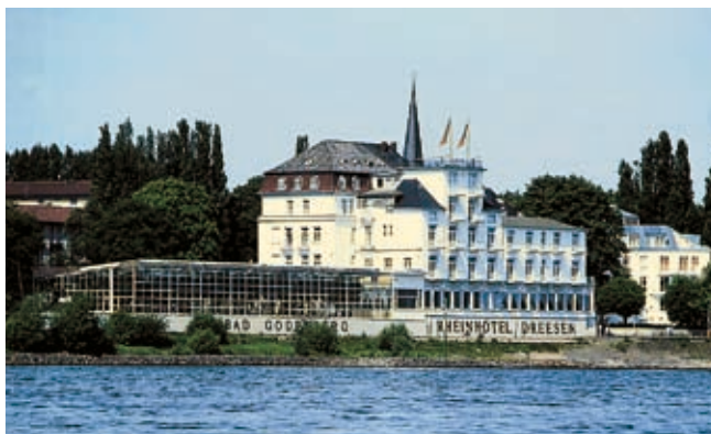
Romantische Lage am Rheinufer: das exquisite Rheinhotel Dreesen

Zimmer für Nichtraucher, Gäste mit Behinderung, Allergiker, Radverleih. ●●●