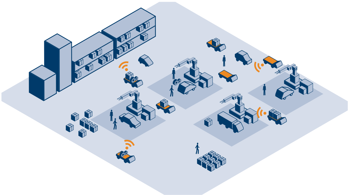
Abbildung 2: Die Smart Factory

rund 250 Milliarden Euro auf etwa zehn Prozent des deutschen Bruttoinlandsprodukts (BIP). 8 Das wertschöpfende Potenzial der Instandhaltung ergibt sich in diesem Kontext aus den vermiedenen drei- bis fünfmal höheren Folgekosten einer mangelhaften oder vernachlässigten Instandhaltung. Demnach erwirtschaftet die Instandhaltung umgerechnet Anlagen- und Produktivitätswerte für die deutsche Industrie von jährlich rund einer Billion Euro.