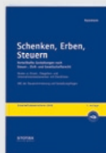
Schenken, Erben, Steuern

Vorteilhafte Gestaltungen nach Steuer-, Zivil- und Gesellschaftsrecht