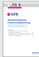
HFR Höchstrichterliche Finanzrechtsprechung