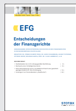
EFG Entscheidungen der Finanzgerichte