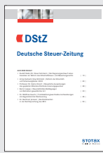
DStZ Deutsche Steuer-Zeitung