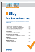
Stbg Die Steuerberatung