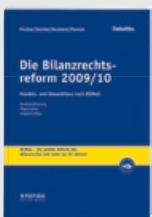
Die Bilanzrechtsreform 2009/10