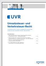
UVR Umsatzsteuer- und Verkehrssteuer-Recht