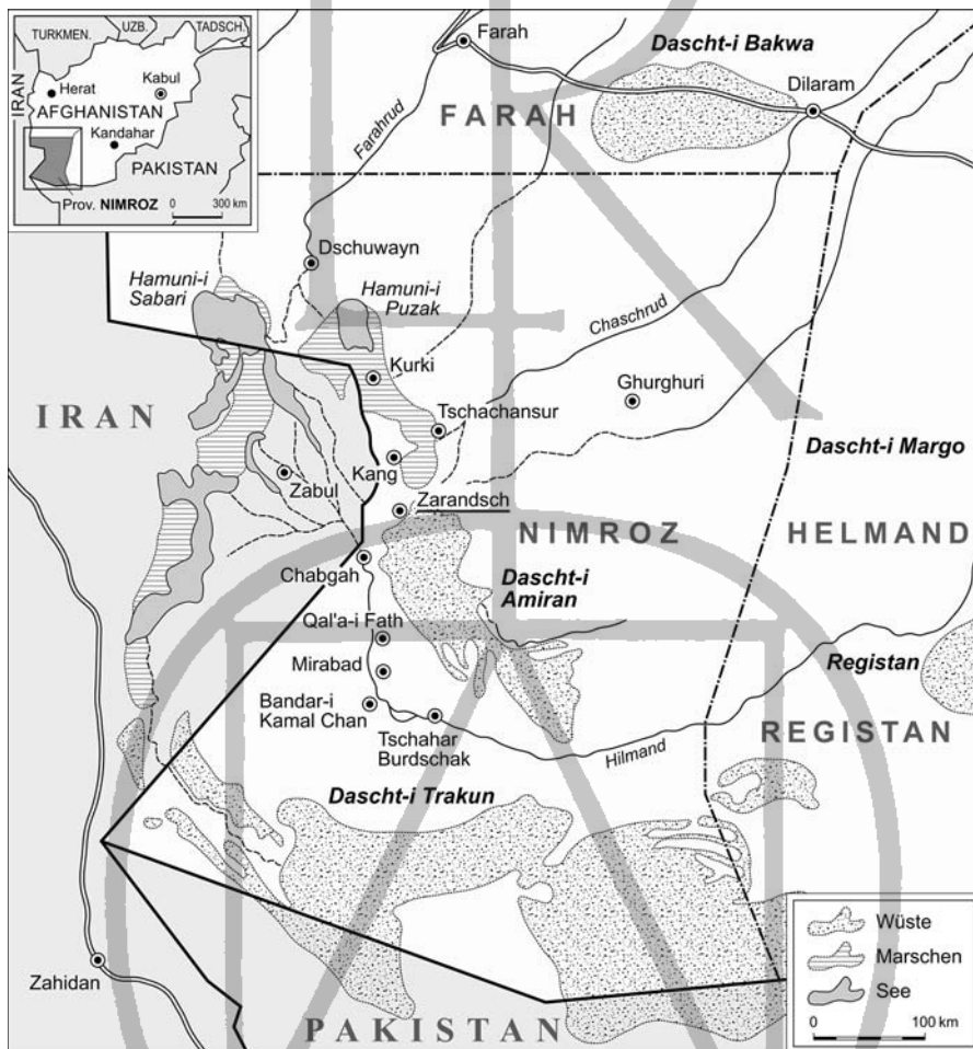
Abbildung 1: Die Provinz Nimroz