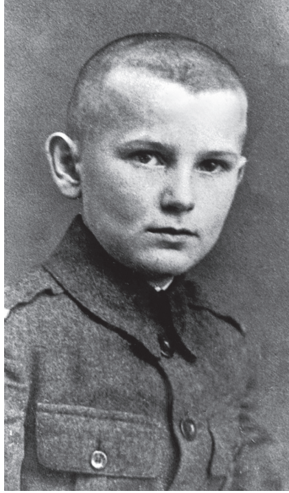
Karol Wojtyła war ein Muster- schüler, der seine Klassen- kameraden nie abschreiben ließ (um 1930)

wegen meiner größeren Reife zu dieser Zeit.» 9 Er bekam das Stethoskop des Bruders, es fand später seinen Platz auf seinem Schreibtisch im Vatikan.