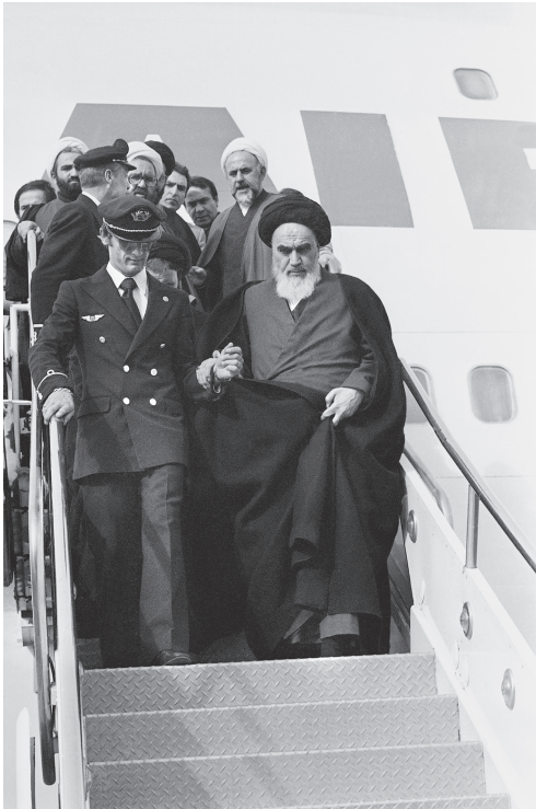
Ayatollah Ruhollah Khomeini bei seiner Rückkehr in den Iran am 1. Februar 1979.

Kurz zuvor hatte der letzte Schah das Land verlassen. Khomeinis Fundamentalisten gewannen rasch die Oberhand in der Revolution, und am 1. April wurde die Islamische Republik Iran ausgerufen.