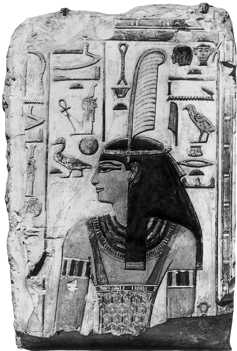
Die Göttin Ma'at, Relief aus dem Grab Sethos' I. (19. Dyn., um 1300 v. Chr.)