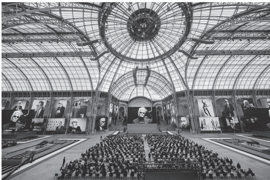
«Karl For Ever»: Gedenkfeier im Grand Palais am 20. Juni 2019