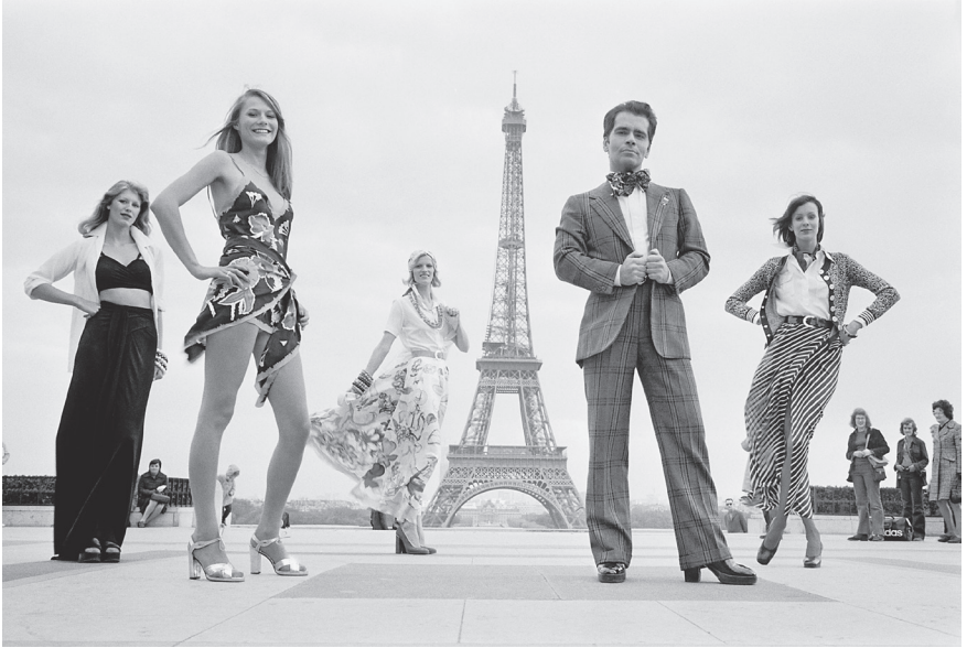
Mit einem Blick für Paris: Karl Lagerfeld stellt seine Mode für Chloé 1972 auf der Esplanade du Trocadéro vor.