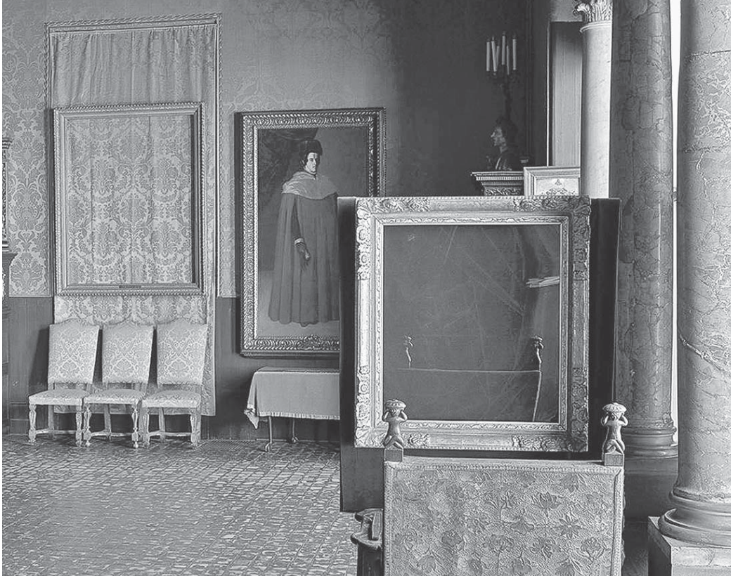
Im Isabella Stewart Gardner Museum in Boston erinnern die leeren Rahmen an die gestohlenen Bilder

Im Isabella Stewart Gardner Museum in Boston erinnern bis heute die leeren Rahmen an den schrecklichen Raub von 1990, bei dem dreizehn Werke verschwanden, darunter Das Konzert von Jan Vermeer, Der Sturm auf dem See Genezareth von Rembrandt und Chez Tortoni von Edouard Manet (Abb. S. 17). Auch nach über dreißig Jahren hofft man in Boston, dass die Bilder wieder auftauchen, zumal die Tat längst verjährt ist.