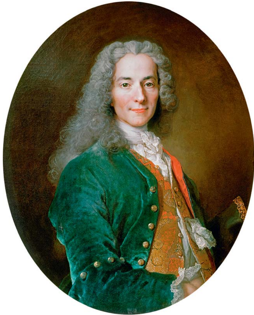
Voltaire im Alter von etwa vierundzwanzig Jahren, Gemälde von Nicolas de Largillière