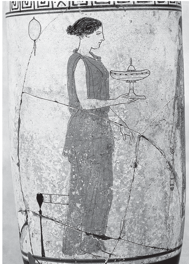
Abb. 2 Frau mit Schale als Gabe an einen Toten. Attische Vasenmalerei, fünftes Jahrhundert v. Chr.

Die zentrale Rolle der Bestattungsriten, des Opferkults für die Toten und der Unterscheidung zwischen gewöhnlichen und herausragenden Verstorbenen bei den Griechen brachte es mit sich, dass sie diesen Aspekten auch bei ihren schriftlosen Nachbarvölkern besondere Beachtung schenkten. Angaben dazu bilden seit dem fünften Jahrhundert v. Chr. einen festen Bestandteil der ethnographischen Schilderungen, die Historiker gemäß einer literarischen Konvention ihren Darstellungen der geschichtlichen Abläufe beigaben. Am Anfang steht dabei Herodot mit seiner ausführlichen Beschreibung der Bestattungssitten bei den Skythen ( Historien 4,71–72): Ihm zufolge wurden die Leichen der skythischen Könige einbalsamiert, mit Wachs überzogen und auf einem Wagen von einem Stamm zum anderen geführt, um die dem Toten gebührenden Trauerriten zu vollziehen. Anschließend wurde der