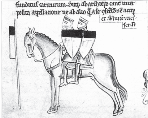
Zwei Templer zu Pferde (wie auf dem ältesten Siegel) mit Ordensbanner, nach der Chronik des Matthäus Parisiensis

die Zukunft der Gemeinschaft führte zur Reise Hugues' nach Frankreich. Diese erbrachte nicht nur die erste schriftlich niedergelegte Regelung der Lebensform, sondern auch die Unterstützung durch den vielleicht prominentesten Vertreter der Kirche in seiner Zeit, den Zisterzienser Bernhard von Clairvaux, der mit seiner Schrift «Über das Lob der neuen Ritterschaft» eine grundlegende Rechtfertigung der Verbindung von Mönch- und Rittertum unternahm. Päpstliche Privilegien und zahlreiche Schenkungen folgten. Aus bescheidenen Anfängen erwuchs so schließlich eine einflussreiche und wirkungsmächtige Korporation, deren Mitglieder mit Päpsten und Königen Umgang pflegten und in vielen Regionen Europas und im Heiligen Land präsent waren. Schätzungsweise zählte die Korporation im 13. Jahrhundert rund 7000 Ritter- und Priesterbrüder, Sergeanten und dienende Brüder, die im lateinischen Westen rund 870 Burgen, Komtureien und weitere Besitzungen des Ordens verwalteten. Die materiellen und personellen Ressourcen des Herkunftsgebiets ermöglichten den Einsatz im sog. Heidenkampf, sowohl im Heiligen Land als auch in Spanien. Das Netzwerk von Templerhäusern, das den Transport von Männern, Pferden, Waffen und Lebensmitteln organisierte, versorgte allein im Heiligen Land wohl bis zu 600 Ritterbrüder und 2000 Sergeanten.